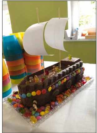
Kuchenbasar – Motto „Schiff ahoi“