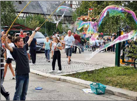
Seifenblasen selbst gemacht