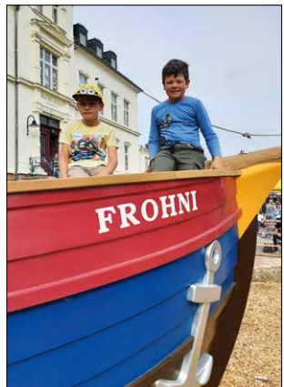
Eroberung des Spielschiffes