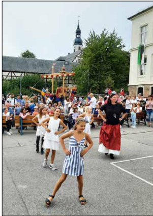
Auftritt der Line – Dancer Gruppe