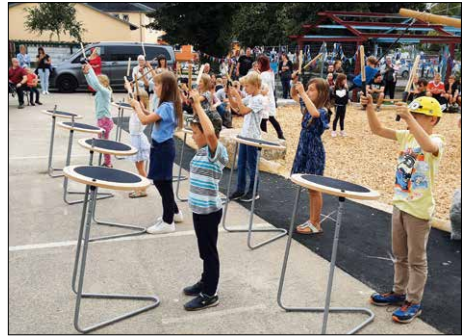
Auftritt der Fit4Drums-Kids