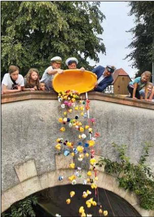
Startschuss zum Entenrennen