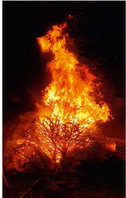
Traditionelles Tannenbaumverbrennen in Niederfrohna